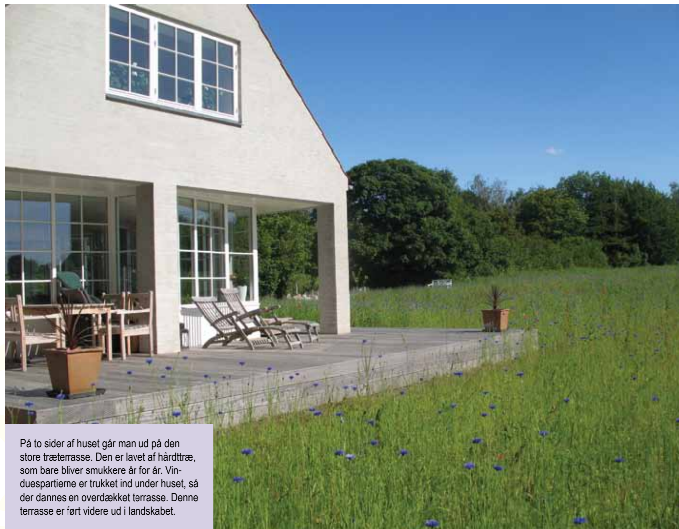
På to sider af huset går man ud på den store træterrasse. Den er lavet af hårdtræ, som bare bliver smukkere år for år. Vinduespartierne er trukket ind under huset, så der dannes en overdækket terrasse. Denne terrasse er ført videre ud i landskabet.

ste tulipaner, påskelliljer og den yndige Bispehue – for ikke at tale om de sene stauder - nydes på nært hold på trods af det lunefulde danske klima. I stedet for at hegne haven ind er der