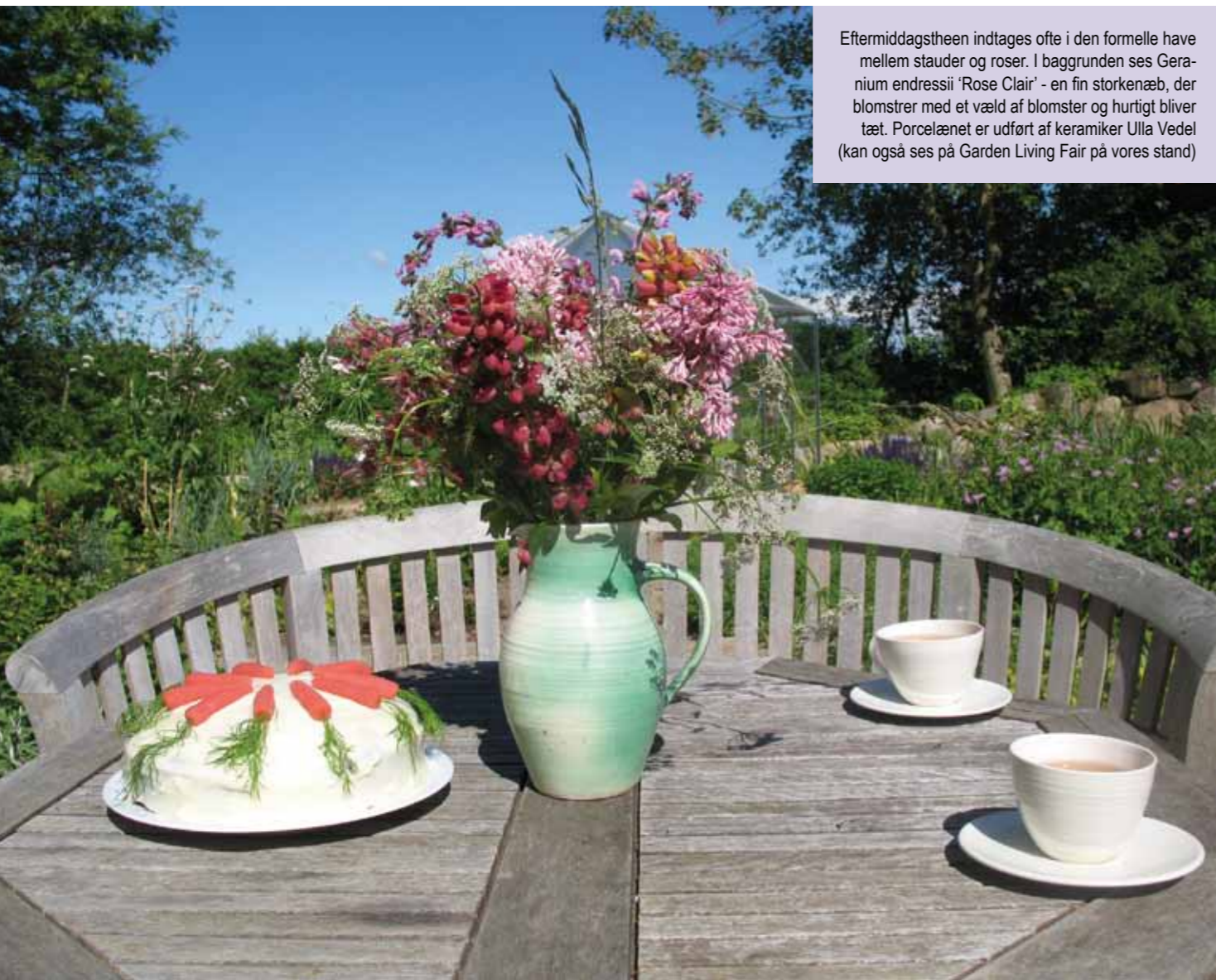
Eftermiddagstheen indtages ofte i den formelle have mellem stauder og roser. I baggrunden ses Geranium endressii 'Rose Clair' - en fin storkenæb, der blomstrer med et væld af blomster og hurtigt bliver tæt. Porcelænet er udført af keramikeren Ulla Vedel (kan også ses på Garden Living Fair på vores stand)