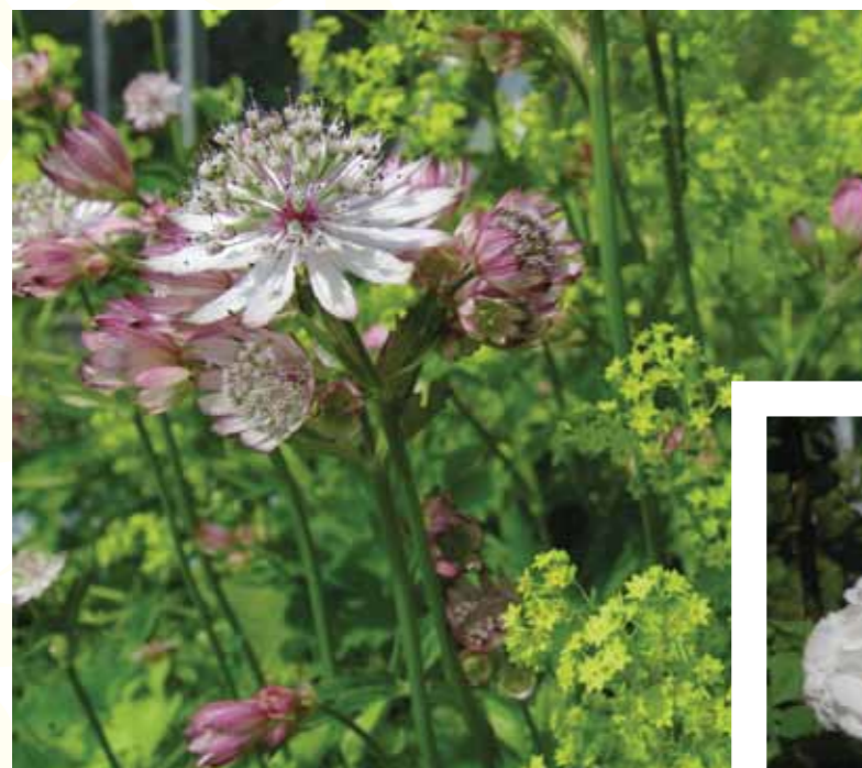
planteskole. Stauderne skal også være robuste, gerne bunddækkende og let skyggetålende.

Fakta Havearkitekt Henriette Lyngsted, www.valsoelille-landskab.dk Arkitekttegnestuen Thue Zeuthen MAA, www.thuezeuthen.dk Porcelæn: Ullas Keramik v/ Ulla Vedel www.ullaskeramik.dk Blomstereng: Nykilde, naturengsblanding, www.nykilde.dk