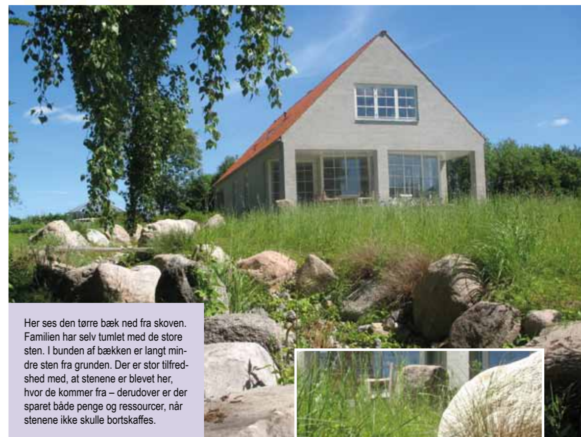
Her ses den tørre bæk ned fra skoven. Familien har selv tumlet med de store sten. I bunden af bækken er langt mindre sten fra grunden. Der er stor tilfredshed med, at stenene er blevet her, hvor de kommer fra – derudover er der sparet både penge og ressourcer, når stenene ikke skulle bortskaffes.

I gårdrummet er haven symmetrisk opbygget med små bede og grusbelagte stier. Buksbomhækkene anviser gangstien fra parkeringspladsen til hoveddøren. De skal være 140 cm høje. Hækkene adskiller også den symmetriske have ▶