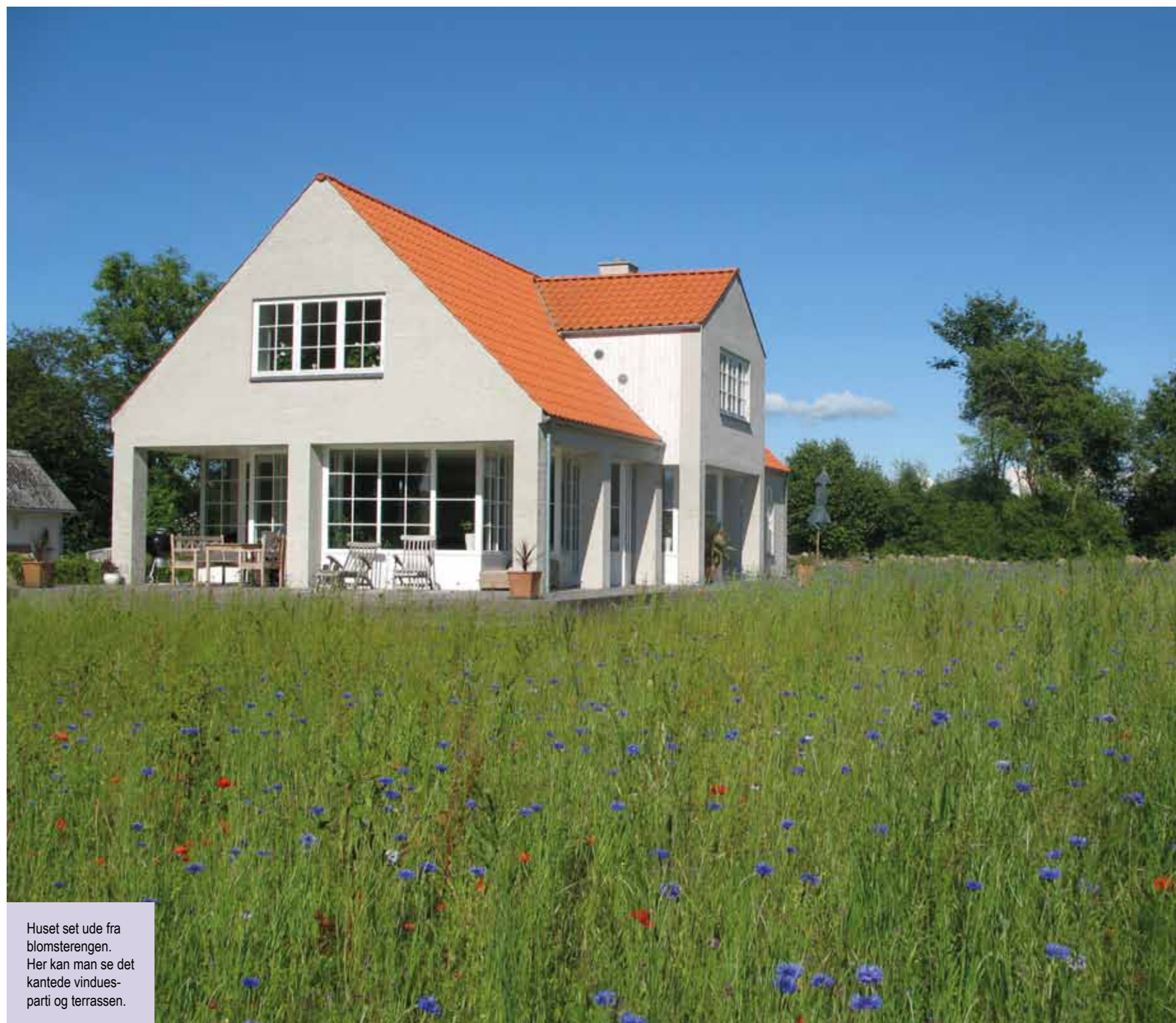
Huset set ude fra blomsterengen. Her kan man se det kantede vinduesparti og terrassen.

Stue, og køkken/alrum er ét stort rum omgivet af et sammenhængende vindue, som består af 8 ens vinklede partier. Det betyder, at man kan følge døgnets og årstidernes gang på tættest hold. Huset er tegnet af arkitekt Thue Zeuthen MAA.