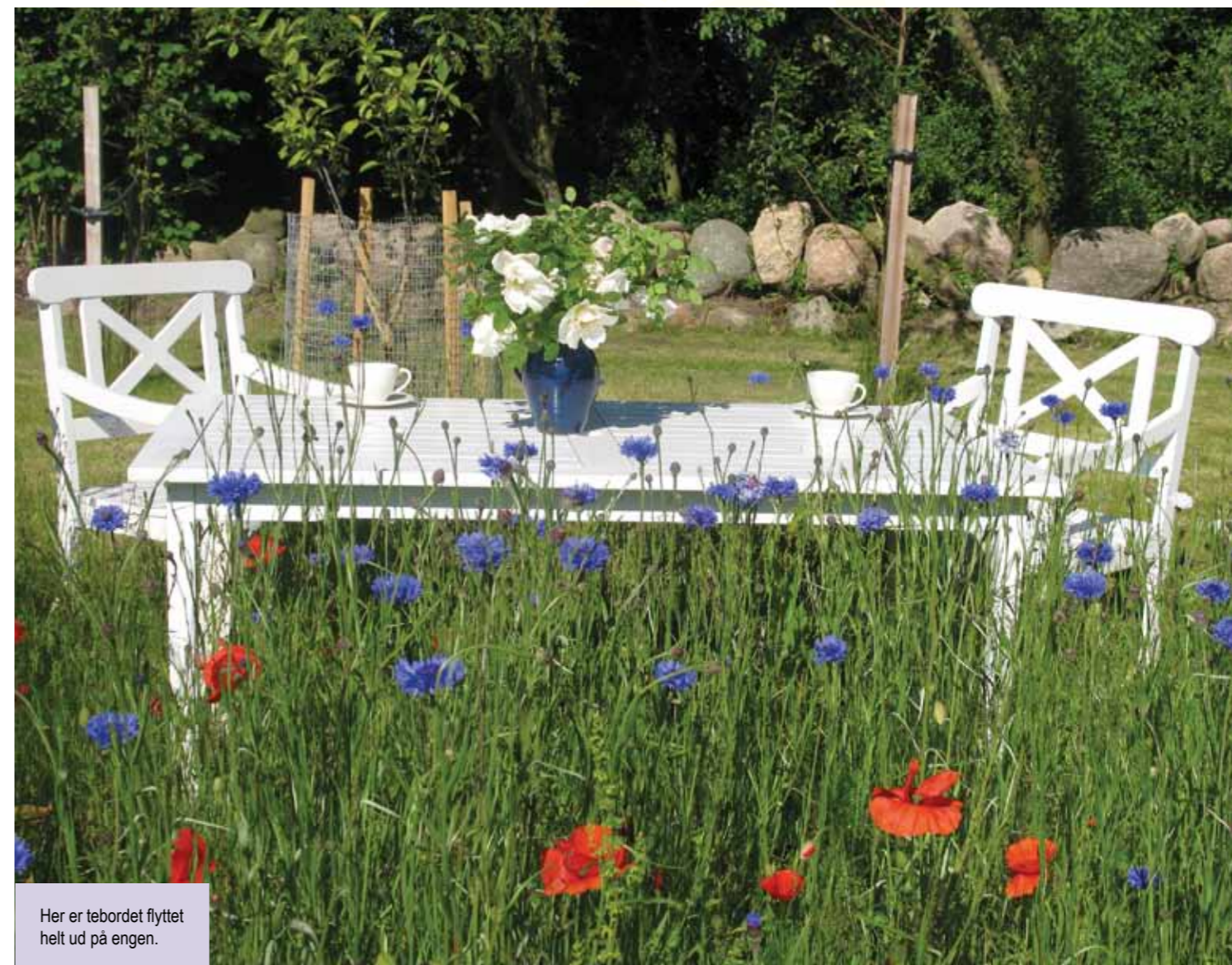
Her er tebordet flyttet helt ud på engen.